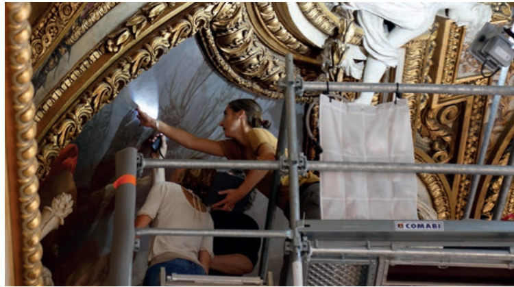
| Travaux de conservation préventive dans la galerie d'Apollon