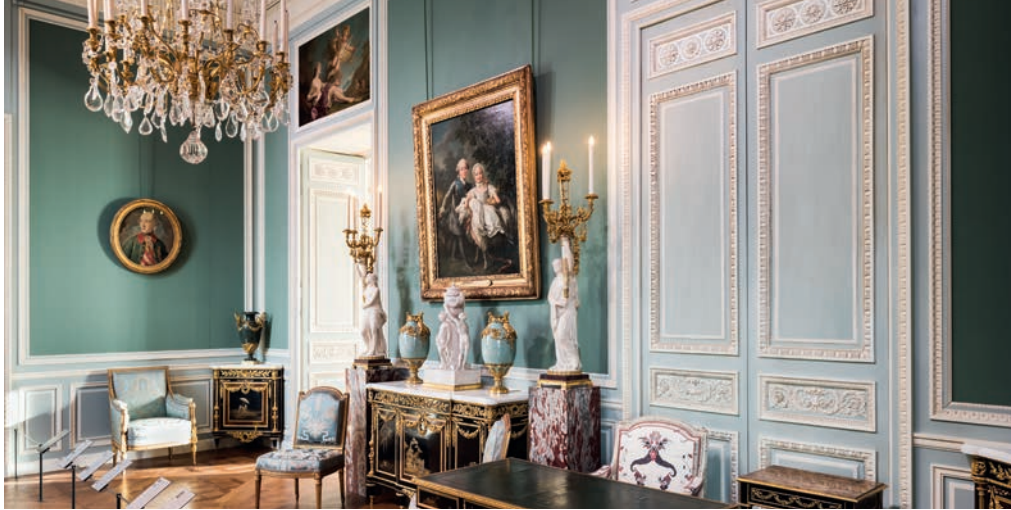
| Salle du département des Objets d'art présentant les collections du château de Bellevue